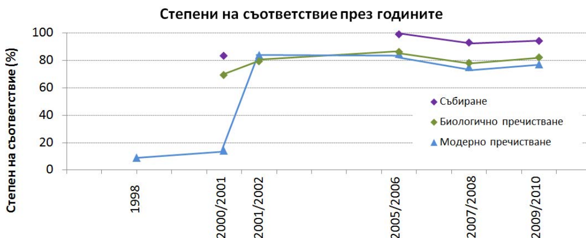
Фигура 3 Степен на съответствие през годините: на тази фигура е отразена промяната по отношение на съответствието с изискванията за събиране, биологично или вторично пречистване и по-строго пречистване, проследена в няколко различни доклада за прилагането (от втория доклад нататък) в съответните отчетни години (1998 г. до 2009—2010 г.). Не всички резултати са на разположение във всички доклади: когато стойностите липсват, те не могат да бъдат представени на фигурата и се появява прекъсване на „линията на тенденцията“.