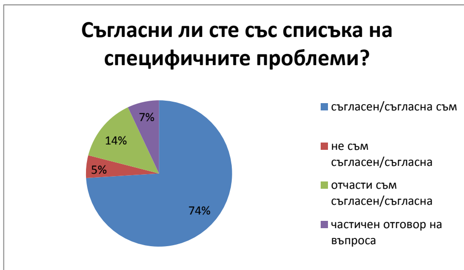
Фигура 3: Отговори на въпроса, свързан със специфичните проблеми, посочени в консултацията:

Налице е широко съгласие, че системата е разпокъсана и че съществуващите инструменти не се изпълняват и прилагат по еднакъв начин. По-доброто прилагане и по-добрата координация са от решаващо значение за подобряването на управлението на океаните.