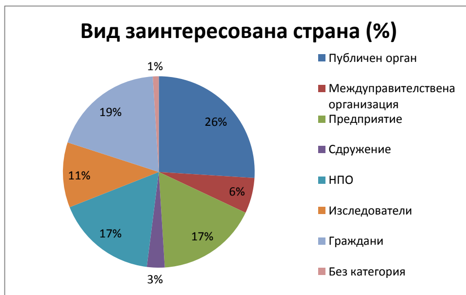
Фигура 1: Отговори в зависимост от вида на заинтересованата страна (%)

Както е показано по-долу, сред респондентите най-голяма е групата на публичните органи (26 %), следвана от гражданите (19 %), неправителствените организации (17 %) и бизнеса (17 %).