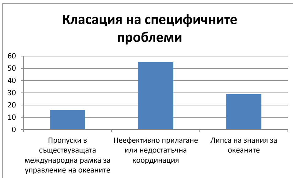
Фигура 4: Класация на специфичните проблеми (%) (включва само респондентите, предоставили класиране)

Много от респондентите споменават инструменти, които са били подписани, но или не са ратифицирани, или не се прилагат ефективно. Насърчаването на доброто прилагане на съществуващите споразумения в рамките на морските форуми, механизмите за налагане на санкции и изграждането на капацитет са