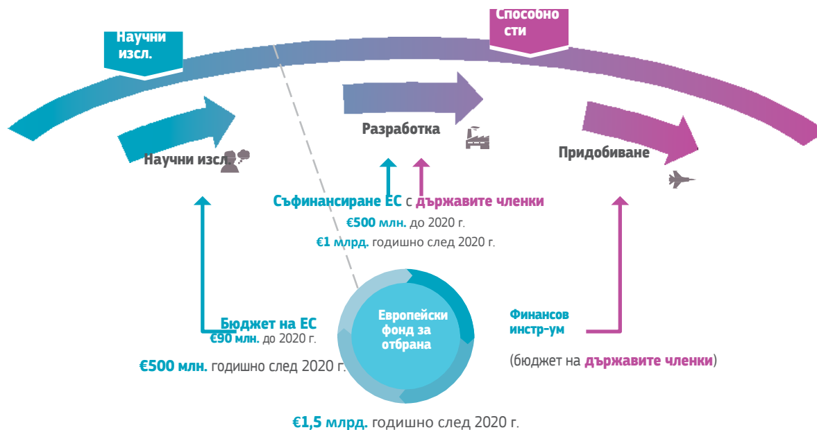
Фигура 1: Европейски фонд за отбрана

Мултиплициращ ефект за инвестициите на ДЧ с цел достигане годишно на €5 млрд. повече в съвместно оборудване