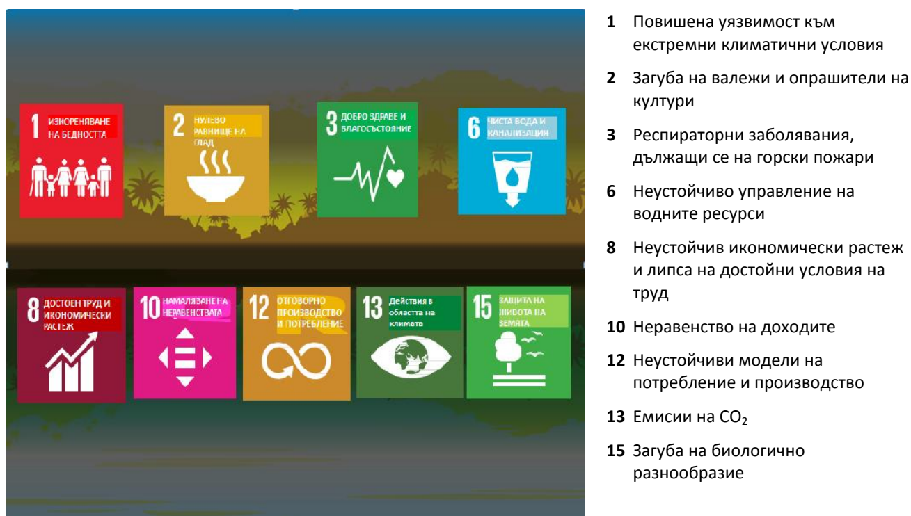
Фигура 2 — Въздействие на обезлесяването върху целите за устойчиво развитие