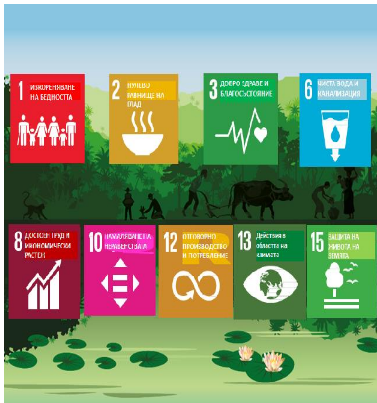
Фигура 1 — Стоки и услуги на горското стопанство в подкрепа на целите на ООН за устойчиво развитие

По-нататъшните мерки на ЕС за опазване на горите ще бъдат в съответствие с международните споразумения и ангажименти, които напълно отчитат необходимостта от амбициозни действия, насочени към постигането на положителен обрат в тенденцията към обезлесяване. Устойчивото управление на горите, тяхното опазване и усилията за възстановяването им се насърчават в рамките на Парижкото споразумение относно изменението на климата и на Глобалния стратегически план за биологичното разнообразие за периода 2011—2020 г., приет по силата на Конвенцията на ООН за биологичното разнообразие и целите за биологичното разнообразие от Аичи 14 . Намаляването на загубата и влошаването на състоянието на горите е приоритет в рамките на Стратегическия план на ООН за горите 15 . Укрепването на усилията за устойчиво управление на горите е от основно значение и за Програмата на ООН до 2030 г. за устойчиво развитие, тъй като горите имат многофункционална роля, която подкрепя постигането на повечето цели за устойчиво развитие.