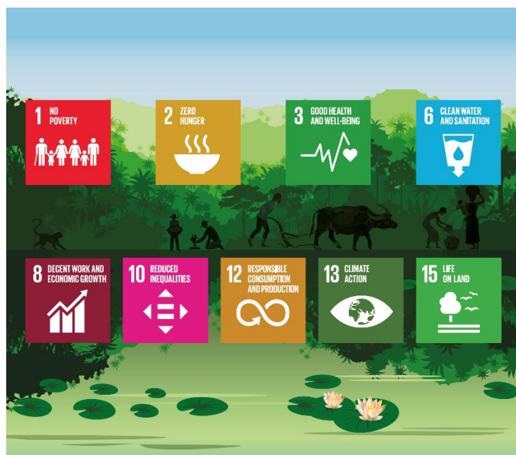
Figure 1 - Biens et services forestiers contribuant aux objectifs de développement durable de l'ONU

De nouvelles mesures de l'UE pour la protection des forêts iraient dans le sens des accords et engagements internationaux, qui reconnaissent pleinement la nécessité d'une action ambitieuse pour inverser la tendance de la déforestation. L'Accord de Paris sur le changement climatique et le Plan stratégique pour la diversité biologique 2011-2020, adopté dans le cadre de la Convention des Nations unies sur la diversité biologique et des Objectifs d'Aichi, plaident pour des actions en faveur d'une gestion, d'une protection et d'une restauration durables des forêts 14 . Faire reculer la perte et la dégradation du couvert forestier est une priorité du Plan stratégique des Nations unies sur les forêts 15 . Le renforcement des efforts de gestion durable des forêts se trouve également au cœur du Programme de développement durable à l'horizon 2030 des Nations unies, car les forêts jouent un rôle multifonctionnel qui contribue à la réalisation de la plupart des objectifs de développement durable.