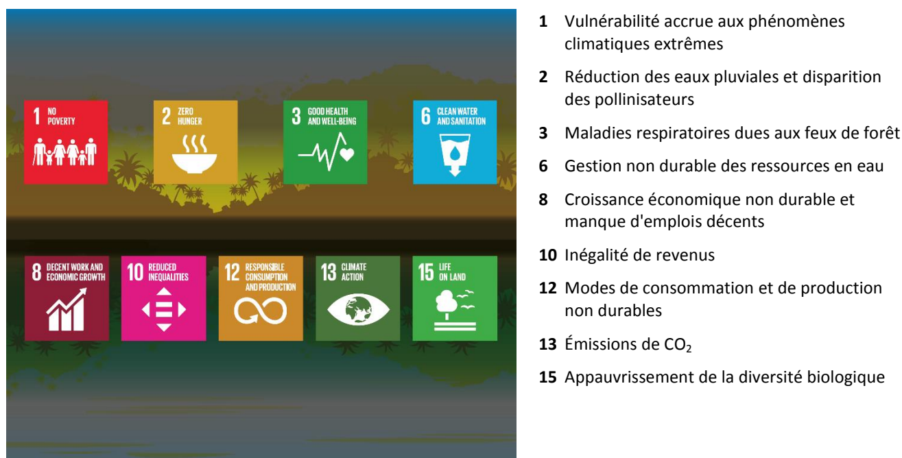
Figure 2 - Impacts de la déforestation sur les objectifs de développement durable