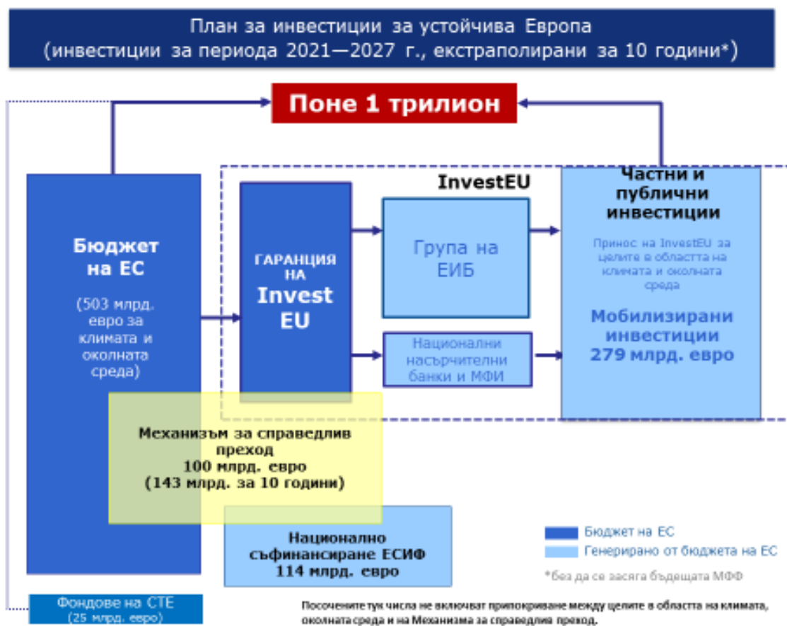
Фигура 3: Финансови елементи, съставляващи поне 1 трилион евро през следващото десетилетие 7 по линия на Плана за инвестиции за устойчива Европа

Въпреки че този принос показва ангажимента на ЕС за финансиране на Зеления пакт, той сам по себе си няма да бъде достатъчен, за да се отключат необходимите инвестиции. Ще е необходим значителен принос от националните бюджети и от частния сектор.