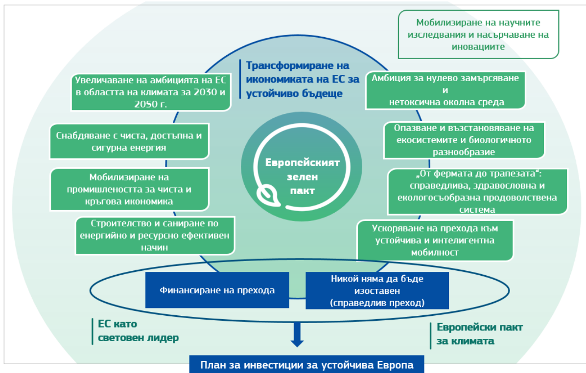
Фигура 1. Планът за инвестиции в рамките на Европейския зелен пакт.

Планът за инвестиции за устойчива Европа ще способства за прехода към неутрална по отношение на климата, зелена икономика по следните три направления: